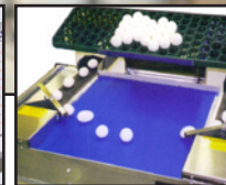
RECOLECCION DE HUEVOS