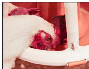
Plato de Machos

La alimentación de los machos es lograda con un plato separado. Alimentación separada para los machos garantiza que reciban la cantidad de alimento necesario, y permite el uso de mezclas y dietas distintas a la de las hembras.