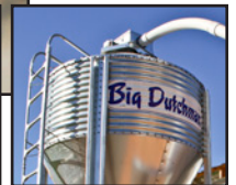
SILOS/SISTEMAS DE LLENADO