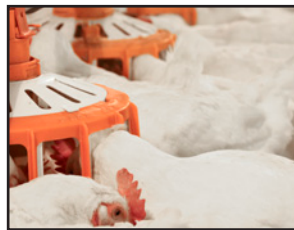
FLUXX para reproductoras

1 Alimentación por plato: Nuestra tecnología de alimentación suministra el alimento uniformemente y es comprobado como el mejor en desarrollar las aves más rápido y grandes.