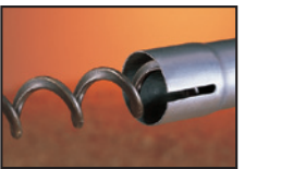
Sinfín y tubo