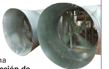
Ventiladores galvanizados y de fibra de vidrio

Para asegurar un ambiente controlado estable en excelente condición para las aves, el sistema de ventilación requiere que utilicen ventanas de entrada de aire y componentes para la extracción de aire, calefactores, enfriadores con paneles evaporativo, y controles completamente automáticos.