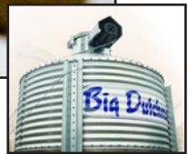
SILOS/SISTEMAS DE LLENADO