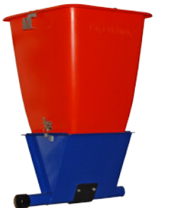
Unidad de comedero y tolva